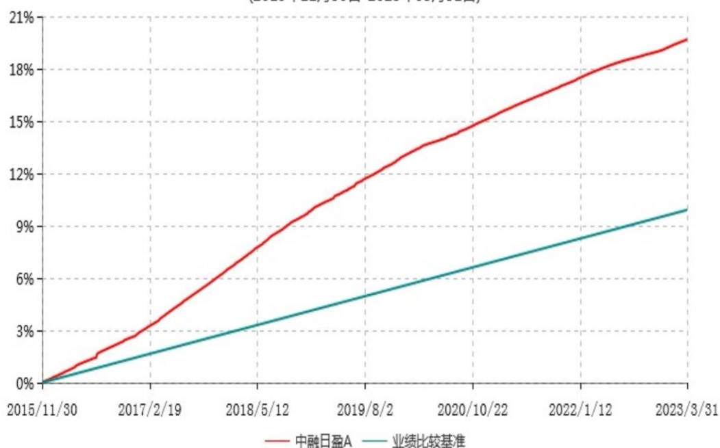
中融日日盈A累计净值收益率与业绩比较基准收益率历史走势对比图 (2015年11月30日-2023年03月31日)