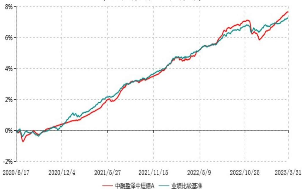
中融盈泽中短债A累计净值增长率与业绩比较基准收益率历史走势对比图 (2020年06月17日-2023年03月31日)