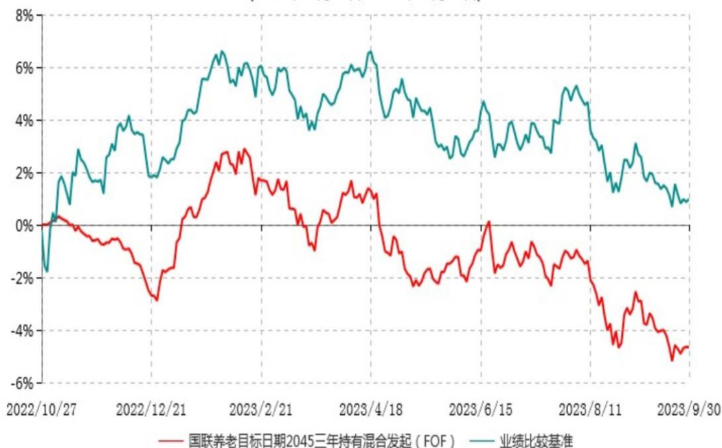
国联养老目标日期2045三年持有期混合型发起式基金中基金 (FOF) 累计净值增长率与业绩比较基准收益率历史走势对比图 (2022年10月27日-2023年09月30日)