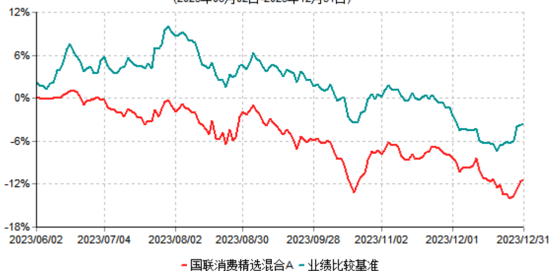
国联消费精选混合A累计净值增长率与业绩比较基准收益率历史走势对比图 (2023年06月02日-2023年12月31日)