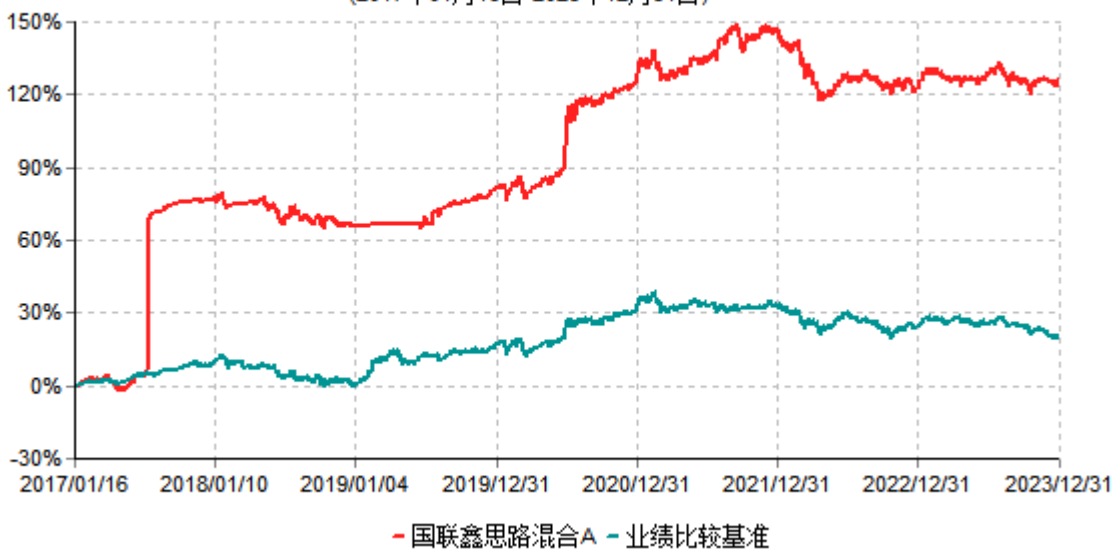
国联鑫思路混合A累计净值增长率与业绩比较基准收益率历史走势对比图 (2017年01月16日-2023年12月31日)