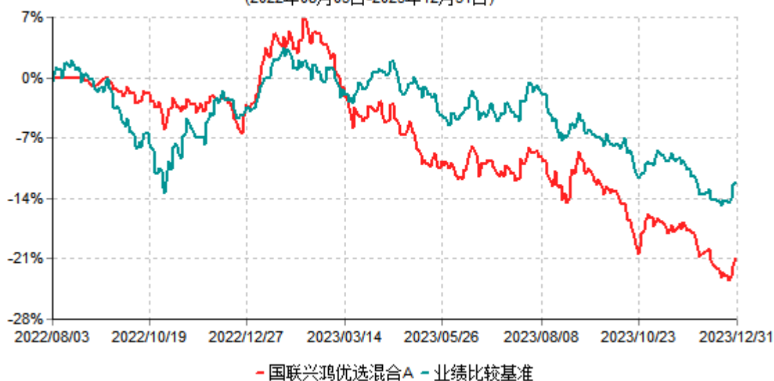
国联兴鸿优选混合A累计净值增长率与业绩比较基准收益率历史走势对比图 (2022年08月03日-2023年12月31日)