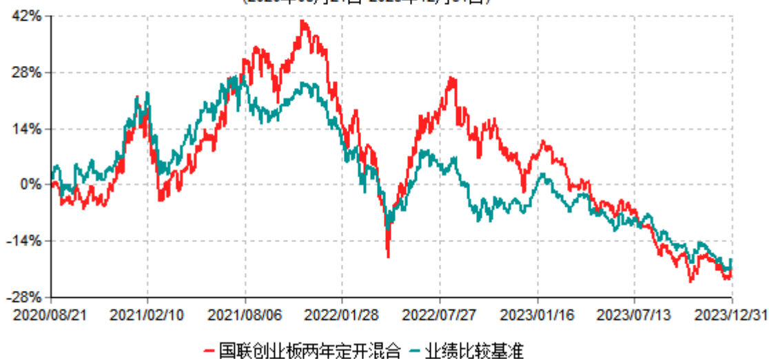
国联创业板两年定期开放混合型证券投资基金累计净值增长率与业绩比较基准收益率历史走势对比图 (2020年08月21日-2023年12月31日)

注：按基金合同和招募说明书的约定，本基金自基金合同生效日起6个月内为建仓期，建仓期结束时本基金的各项投资比例符合基金合同的有关约定。