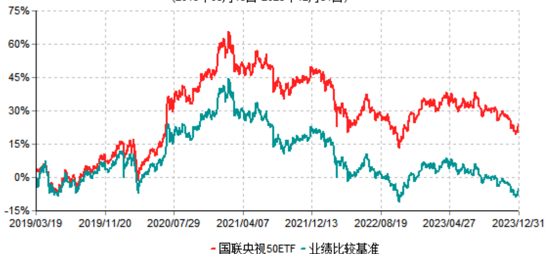
国联央视财经50交易型开放式指数证券投资基金累计净值增长率与业绩比较基准收益率历史走势对比图 (2019年03月19日-2023年12月31日)

注：按基金合同和招募说明书的约定，本基金自基金合同生效日起6个月内为建仓期，建仓期结束时本基金的各项投资比例符合基金合同的有关约定。