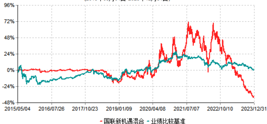
国联新机遇灵活配置混合型证券投资基金累计净值增长率与业绩比较基准收益率历史走势对比图 (2015年05月04日-2023年12月31日)

注：按基金合同和招募说明书的约定，本基金自基金合同生效日起6个月内为建仓期，建仓期结束时本基金的各项投资比例符合基金合同的有关约定。