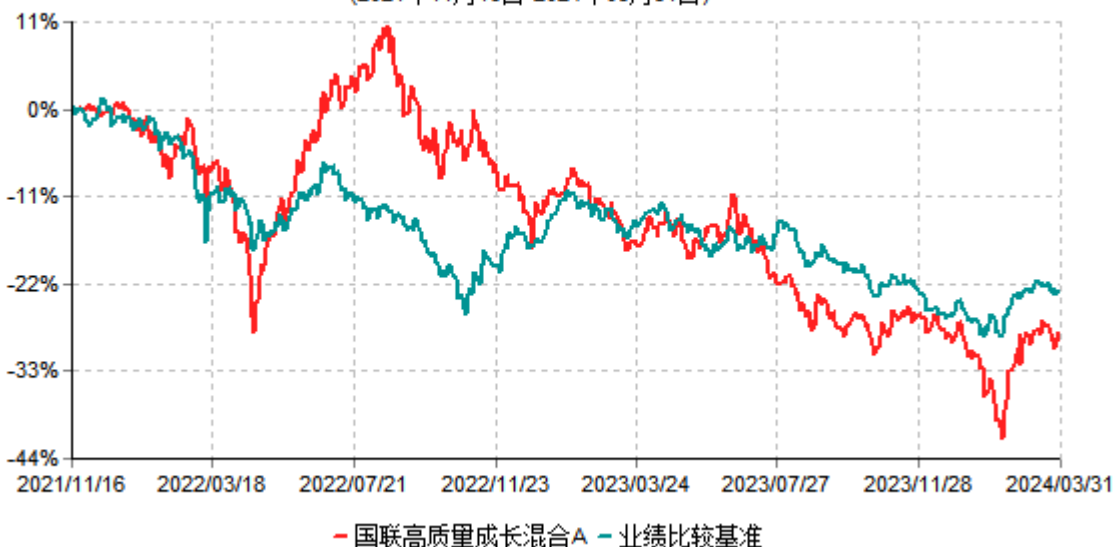
国联高质量成长混合A累计净值增长率与业绩比较基准收益率历史走势对比图 (2021年11月16日-2024年03月31日)