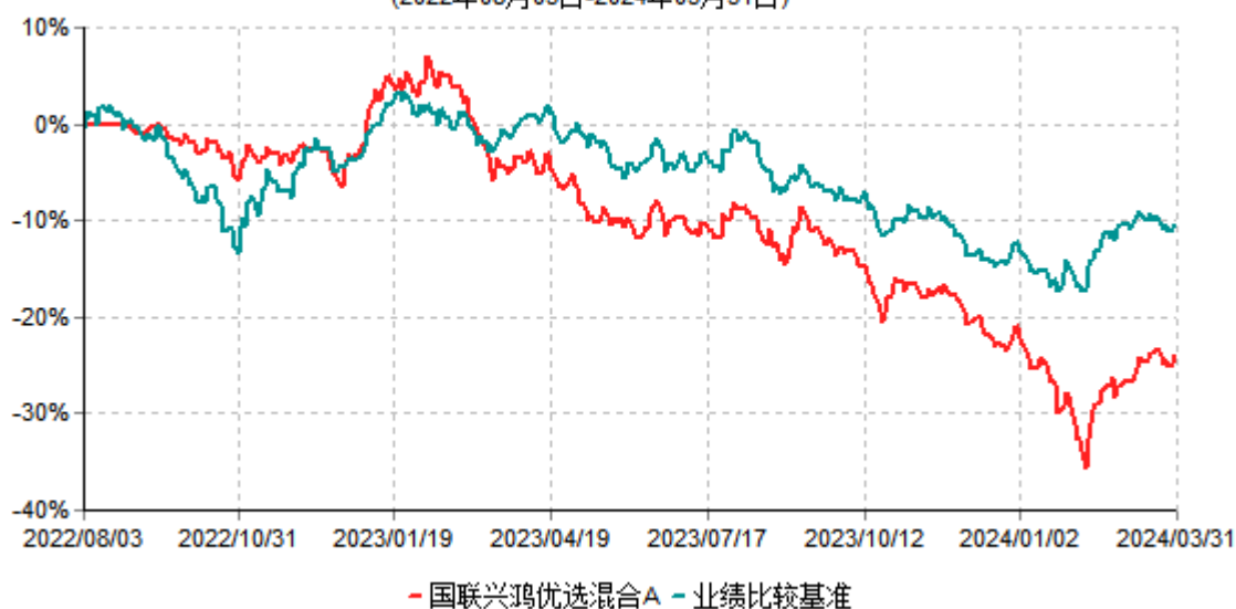
国联兴鸿优选混合A累计净值增长率与业绩比较基准收益率历史走势对比图 (2022年08月03日-2024年03月31日)