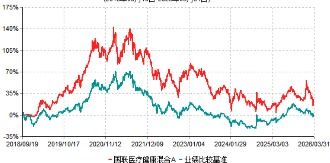
国联医疗健康混合A累计净值增长率与业绩比较基准收益率历史走势对比图 (2018年09月19日-2026年03月31日)