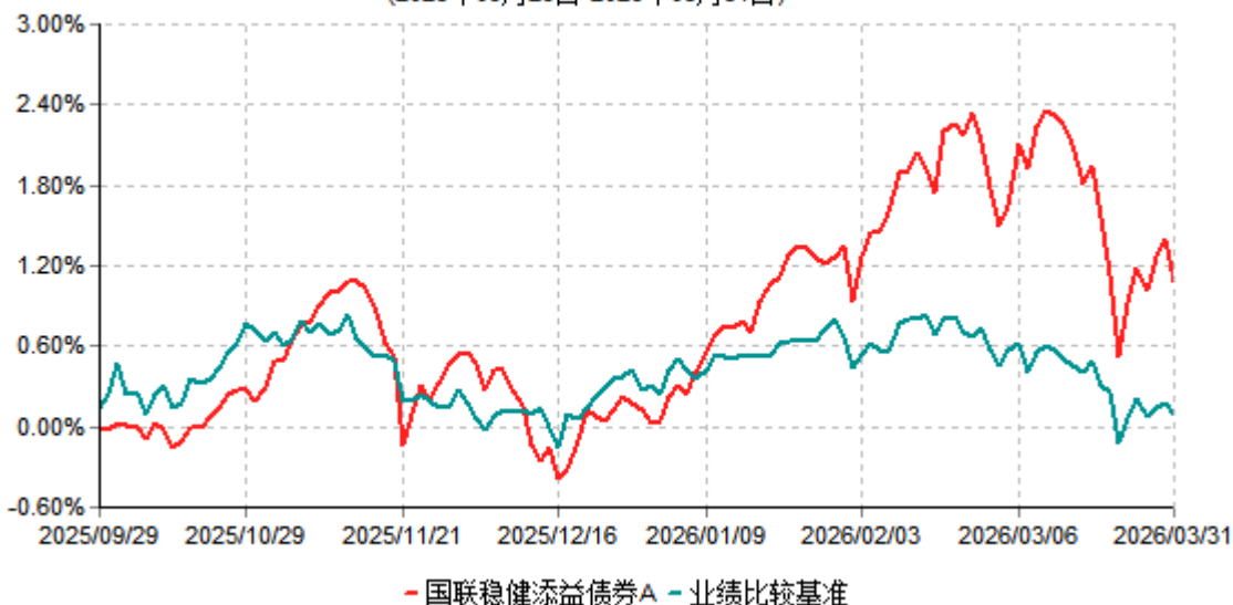
国联稳健添益债券A累计净值增长率与业绩比较基准收益率历史走势对比图 (2025年09月29日-2026年03月31日)