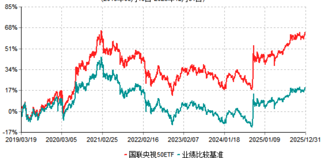
国联央视50ETF累计净值增长率与业绩比较基准收益率历史走势对比图 (2019年03月19日-2025年12月31日)

注：按基金合同和招募说明书的约定，本基金自基金合同生效日起6个月内为建仓期，建仓期结束时本基金的各项投资比例符合基金合同的有关约定。