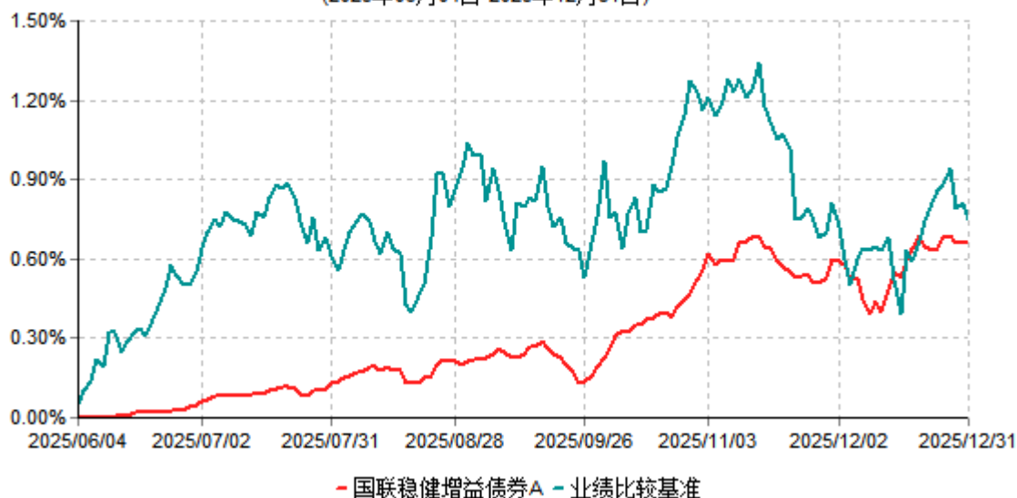
国联稳健增益债券A累计净值增长率与业绩比较基准收益率历史走势对比图 (2025年06月04日-2025年12月31日)