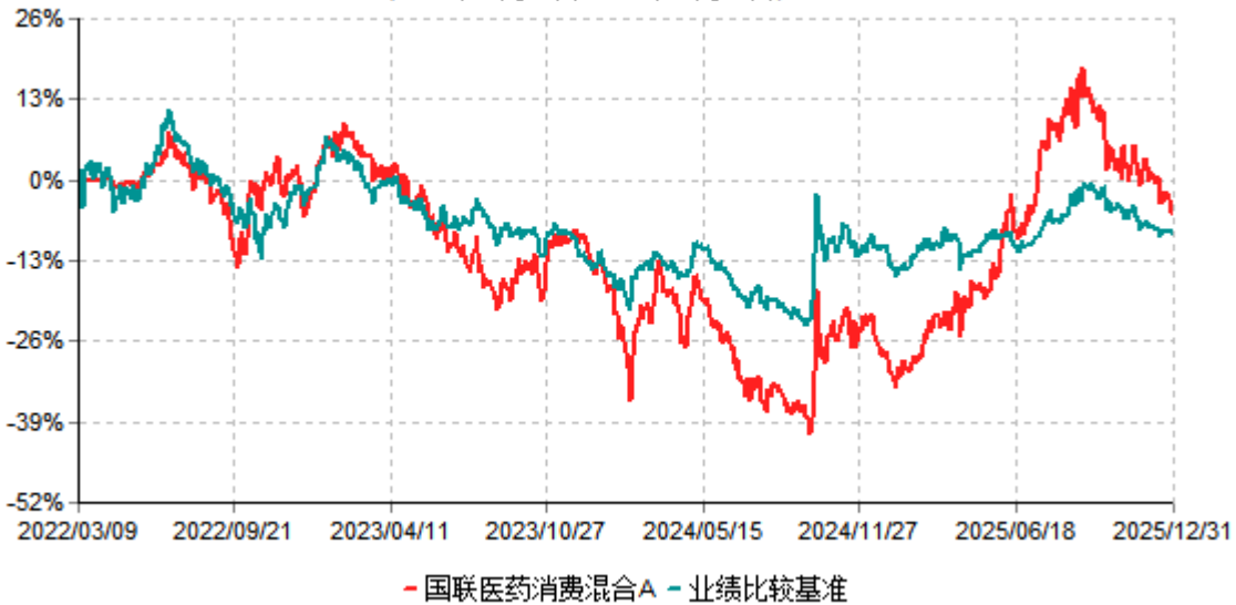
国联医药消费混合A累计净值增长率与业绩比较基准收益率历史走势对比图 (2022年03月09日-2025年12月31日)