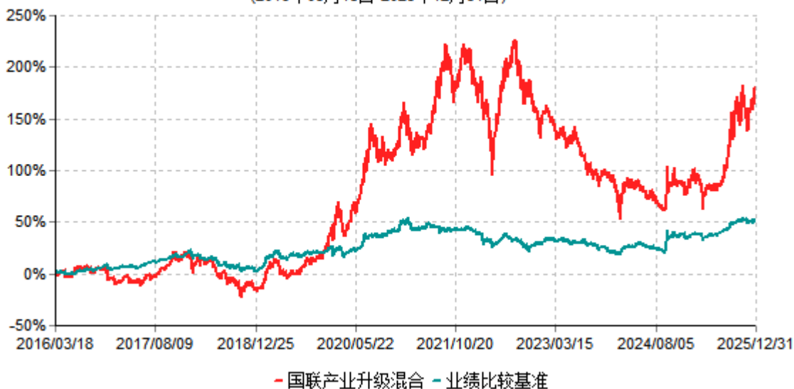
国联产业升级混合累计净值增长率与业绩比较基准收益率历史走势对比图 (2016年03月18日-2025年12月31日)

注：按基金合同和招募说明书的约定，本基金自基金合同生效日起6个月内为建仓期，建仓期结束时本基金的各项投资比例符合基金合同的有关约定。