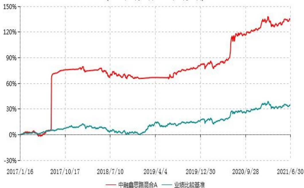
中融鑫思路混合A累计净值增长率与业绩比较基准收益率历史走势对比图 (2017年01月16日-2021年06月30日)