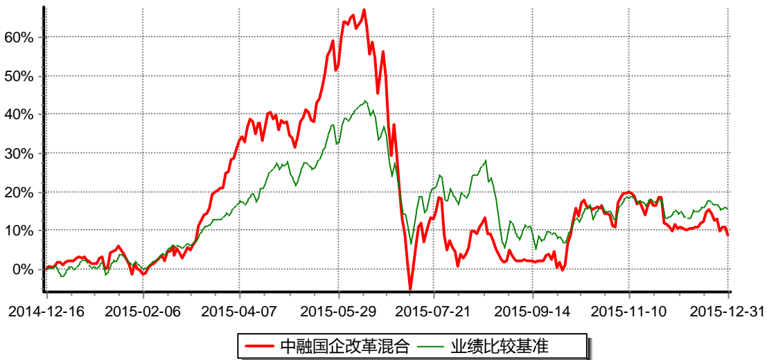
图：中融国企改革灵活配置混合型证券投资基金增长率与同期业绩比较基准收益率历史走势对比图 (2014年12月16日至2015年12月31日)

注：本基金基金合同生效日2014年12月16日至报告期已满1年。按基金合同和招募说明书的约定，本基金自基金合同生效日起6个月内为建仓期，建仓期结束时本基金的各项资产配置比例符合基金合同的有关约定。