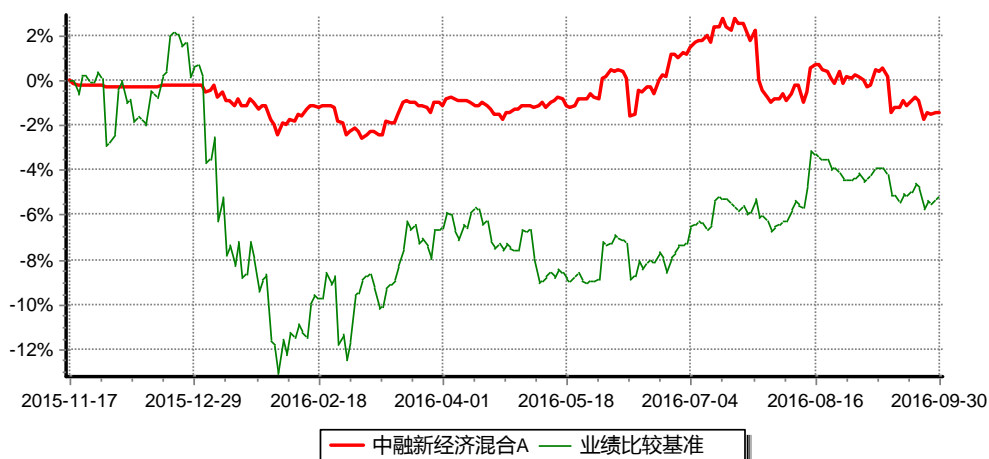
中融新经济混合A份额累计净值增长率与同期业绩比较基准收益率历史走势对比图 (2015年11月17日至2016年9月30日)