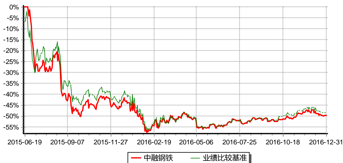
图：中融国证钢铁行业指数分级证券投资基金份额累计净值增长率与同期业绩比较基准收益率的历史走势对比图