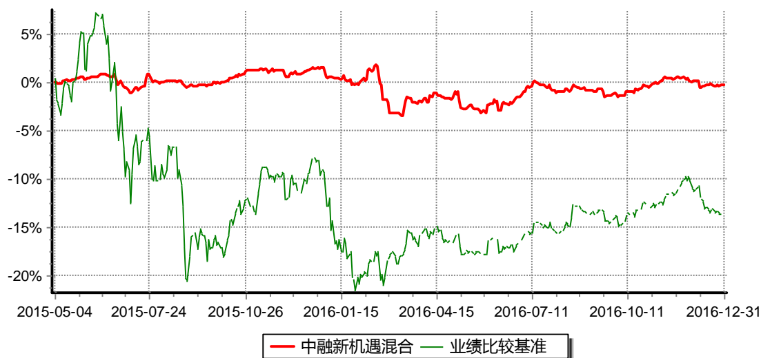
图：中融新机遇灵活配置混合型证券投资基金份额累计净值增长率与同期业绩比较基准收益率的历史走势对比图