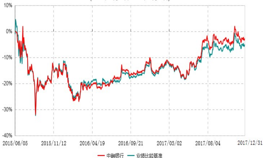
中融中证银行指数分级证券投资基金累计净值增长率与业绩比较基准收益率历史走势对比图 (2015年06月05日-2017年12月31日)

注：按照基金合同和招募说明书的约定，本基金自合同生效日起6个月内为建仓期，建仓期结束时本基金的各项资产配置比例符合基金合同的有关约定。