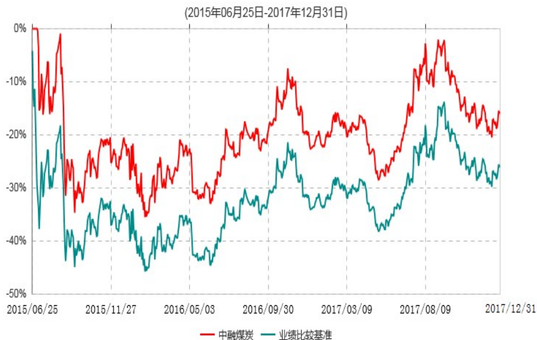
中融中证煤炭指数分级证券投资基金累计净值增长率与业绩比较基准收益率历史走势对比图