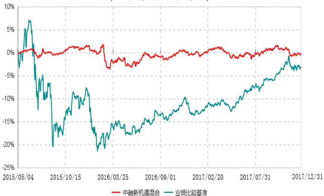
中融新机遇灵活配置混合型证券投资基金累计净值增长率与业绩比较基准收益率历史走势对比图 (2015年05月04日-2017年12月31日)

注：按照基金合同和招募说明书的约定，本基金自合同生效日起6个月内为建仓期，建仓期结束时本基金的各项资产配置比例符合基金合同的有关约定。