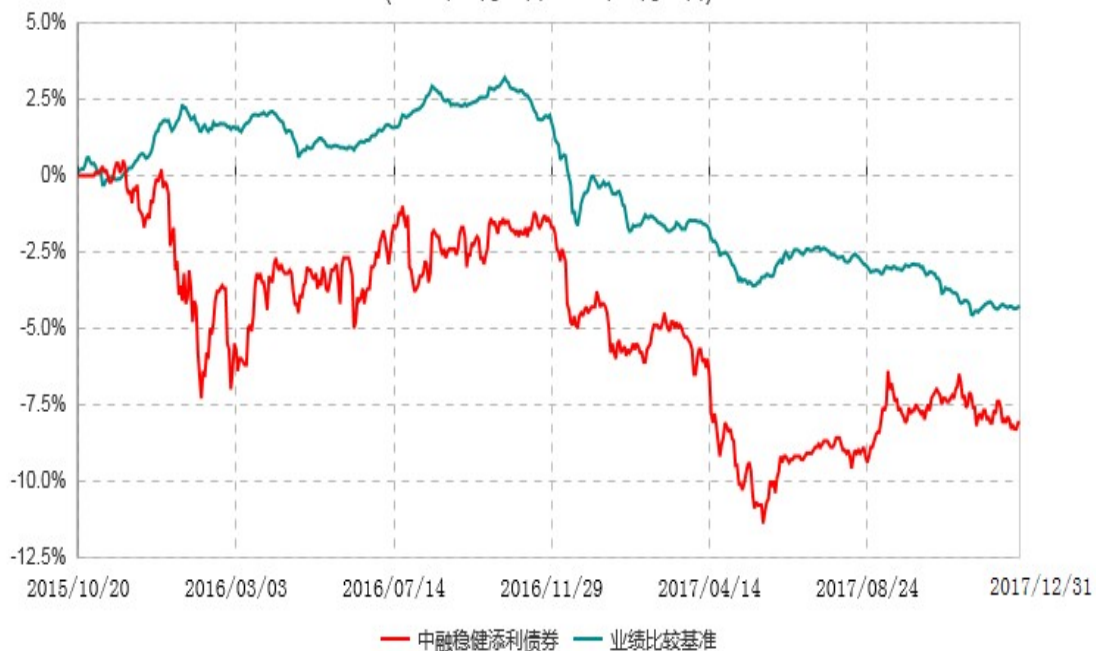
中融稳健添利债券型证券投资基金累计净值增长率与业绩比较基准收益率历史走势对比图 (2015年10月20日-2017年12月31日)

注：按照基金合同和招募说明书的约定，本基金自合同生效日起6个月内为建仓期，建仓期结束时本基金的各项资产配置比例符合基金合同的有关约定。