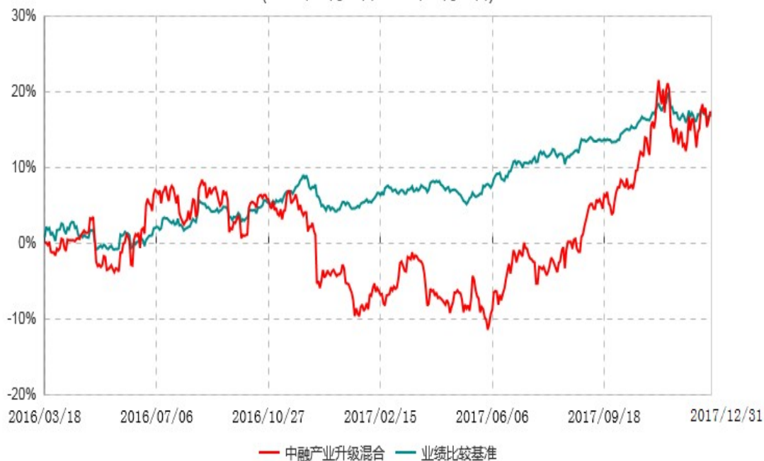
中融产业升级灵活配置混合型证券投资基金累计净值增长率与业绩比较基准收益率历史走势对比图 (2016年03月18日-2017年12月31日)

注：按照基金合同和招募说明书的约定，本基金自合同生效日起6个月内为建仓期，建仓期结束时本基金的各项资产配置比例符合基金合同的有关约定。