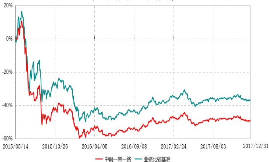
中融中证一带一路主题指数分级证券投资基金累计净值增长率与业绩比较基准收益率历史走势对比图 (2015年05月14日-2017年12月31日)

注：按照基金合同和招募说明书的约定，本基金自合同生效日起6个月内为建仓期，建仓期结束时本基金的各项资产配置比例符合基金合同的有关约定。