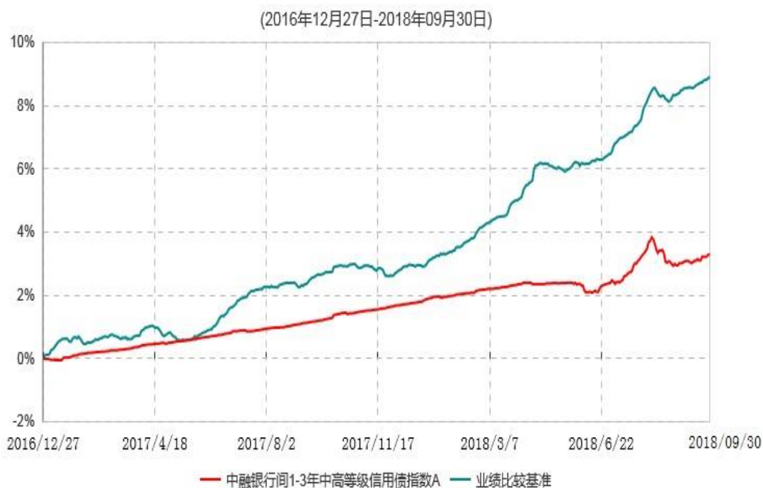
中融银行间1-3年中高等级信用债指数A累计净值增长率与业绩比较基准收益率历史走势对比图