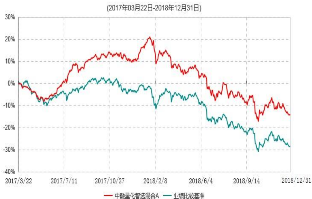
中融量化智选混合A累计净值增长率与业绩比较基准收益率历史走势对比图