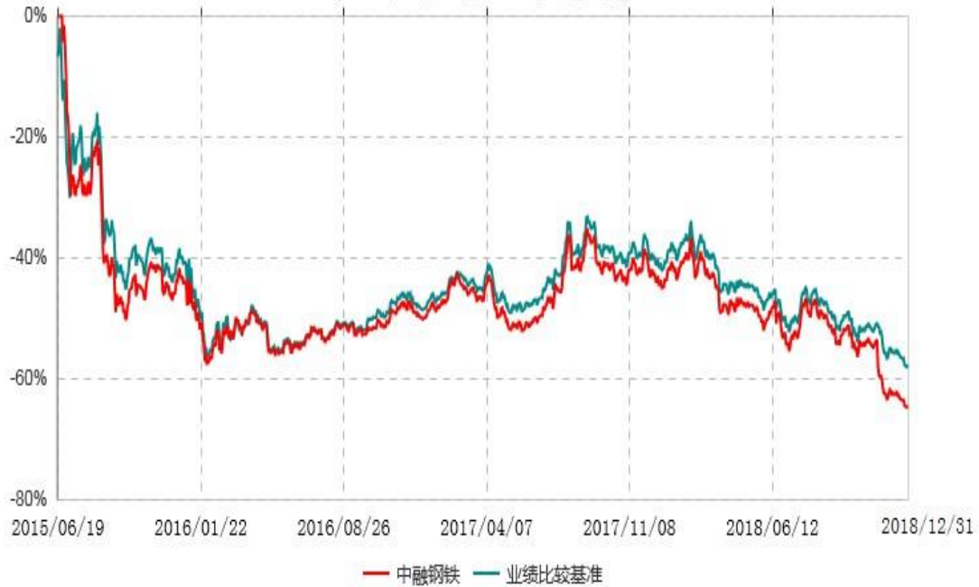
中融国证钢铁行业指数分级证券投资基金累计净值增长率与业绩比较基准收益率历史走势对比图 (2015年06月19日-2018年12月31日)

注：按照基金合同和招募说明书的约定，本基金自合同生效日起6个月内为建仓期，建仓期结束时本基金的各项资产配置比例符合基金合同的有关约定。