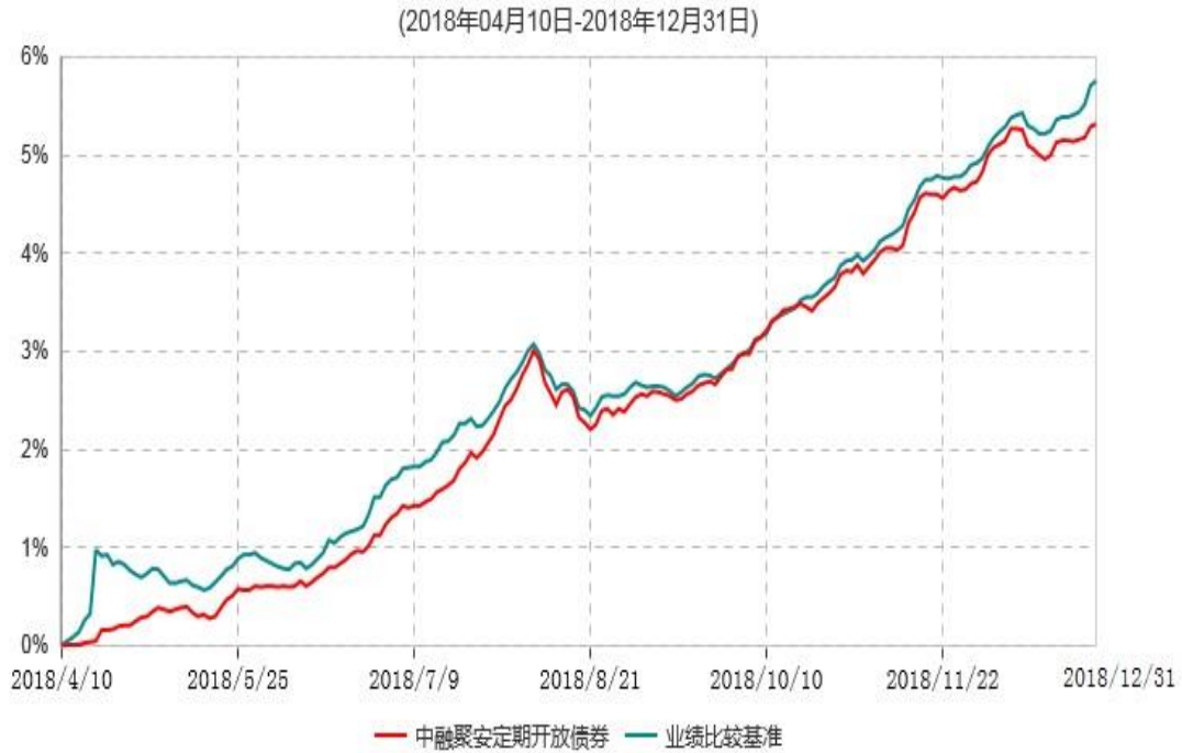
中融聚安3个月定期开放债券型发起式证券投资基金累计净值增长率与业绩比较基准收益率历史走势对比图

注：按照基金合同和招募说明书的约定，本基金自合同生效日起6个月内为建仓期，建仓期结束时本基金的各项资产配置比例符合基金合同的有关约定。