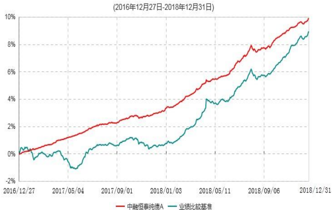
中融恒泰纯债A累计净值增长率与业绩比较基准收益率历史走势对比图