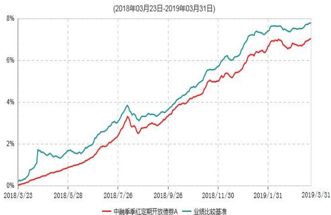
中融季季红定期开放债券A累计净值增长率与业绩比较基准收益率历史走势对比图