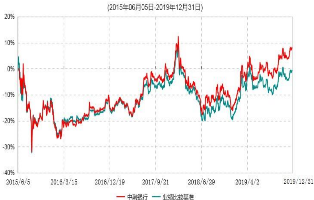
中融中证银行指数分级证券投资基金累计净值增长率与业绩比较基准收益率历史走势对比图

注：按基金合同和招募说明书的约定，本基金自基金合同生效日起6个月内为建仓期，建仓期结束时本基金的各项投资比例符合基金合同的有关约定。