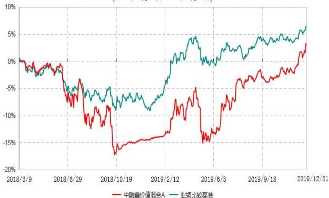
中融鑫价值混合C累计净值增长率与业绩比较基准收益率历史走势对比图