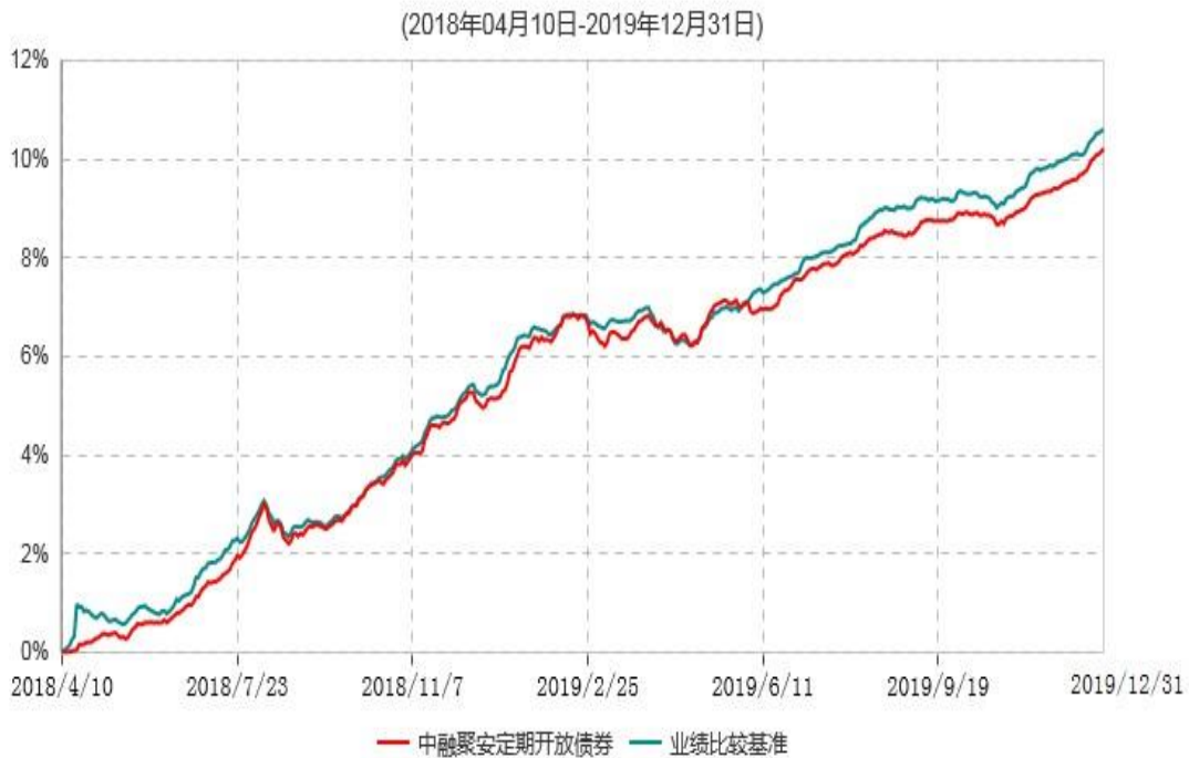
中融聚安3个月定期开放债券型发起式证券投资基金累计净值增长率与业绩比较基准收益率历史走势对比图

注：按基金合同和招募说明书的约定，本基金自基金合同生效日起6个月内为建仓期，建仓期结束时本基金的各项投资比例符合基金合同的有关约定。