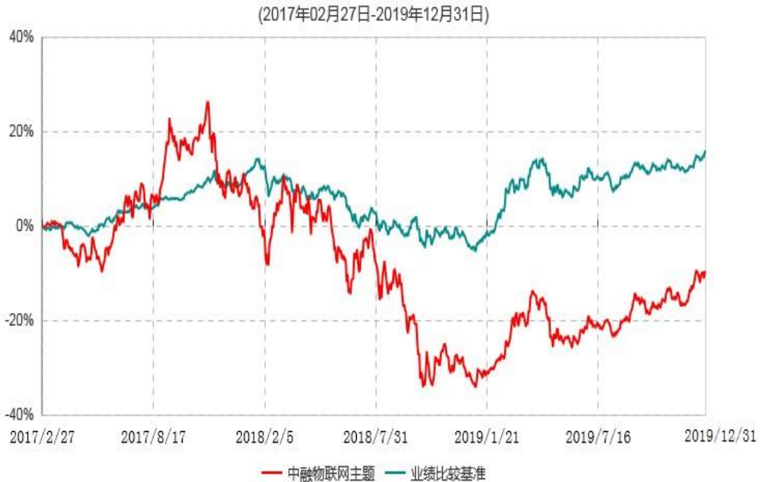
中融物联网主题灵活配置混合型证券投资基金累计净值增长率与业绩比较基准收益率历史走势对比图

注：按基金合同和招募说明书的约定，本基金自基金合同生效日起6个月内为建仓期，建仓期结束时本基金的各项投资比例符合基金合同的有关约定。