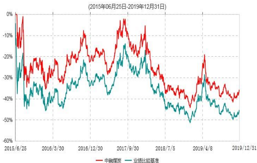
中融中证煤炭指数分级证券投资基金累计净值增长率与业绩比较基准收益率历史走势对比图

注：按基金合同和招募说明书的约定，本基金自基金合同生效日起6个月内为建仓期，建仓期结束时本基金的各项投资比例符合基金合同的有关约定。