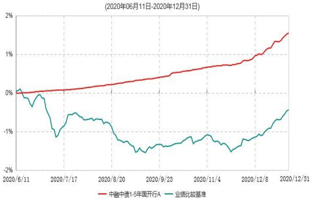
中融中债1-5年国开行A累计净值增长率与业绩比较基准收益率历史走势对比图