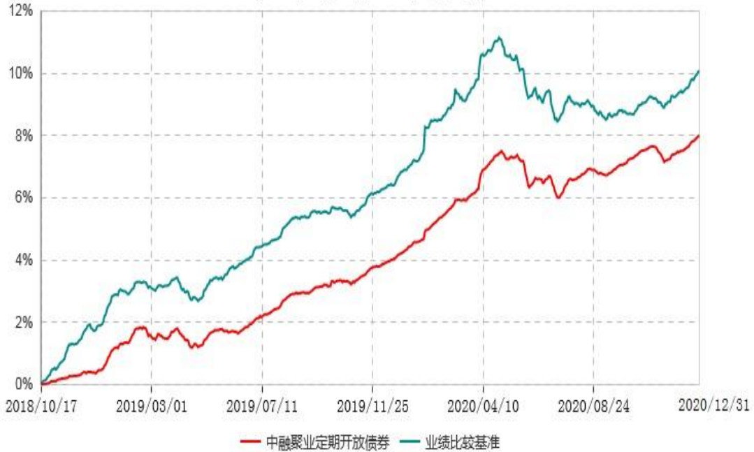
中融聚业3个月定期开放债券型发起式证券投资基金累计净值增长率与业绩比较基准收益率历史走势对比图 (2018年10月17日-2020年12月31日)

注：按基金合同和招募说明书的约定，本基金自基金合同生效日起6个月内为建仓期，建仓期结束时本基金的各项投资比例符合基金合同的有关约定。