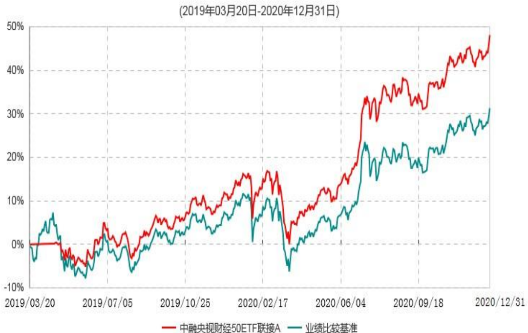
中融央视财经50ETF联接A累计净值增长率与业绩比较基准收益率历史走势对比图