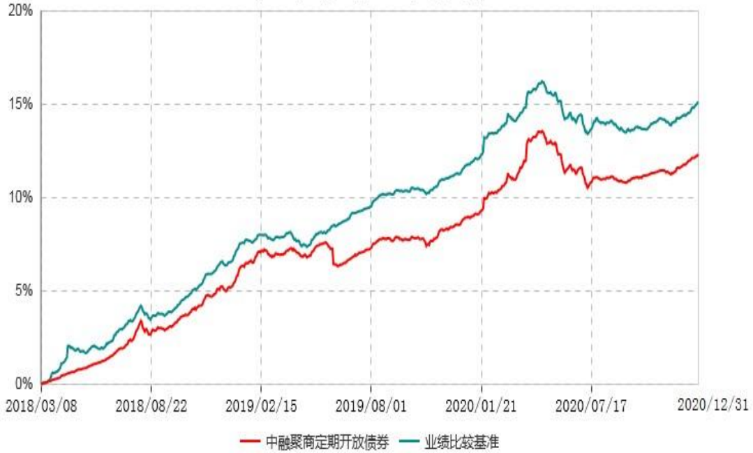
中融聚商3个月定期开放债券型发起式证券投资基金累计净值增长率与业绩比较基准收益率历史走势对比图 (2018年03月08日-2020年12月31日)

注：按基金合同和招募说明书的约定，本基金自基金合同生效日起6个月内为建仓期，建仓期结束时本基金的各项投资比例符合基金合同的有关约定。